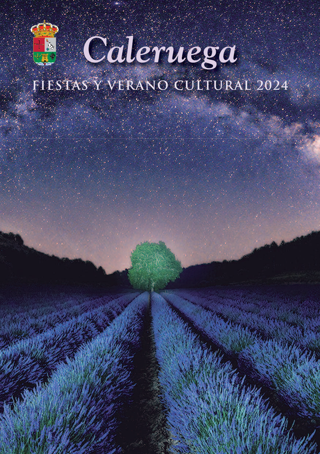
Foto portada: Concurso fotografía 2023. Premio Jurado Profesional: "Lavandarco" de Carlos Cuñado. Foto contraportada: Concurso fotografía 2023. Premio Jurado popular: Desde "el monte alio" de Mariano Calleja.